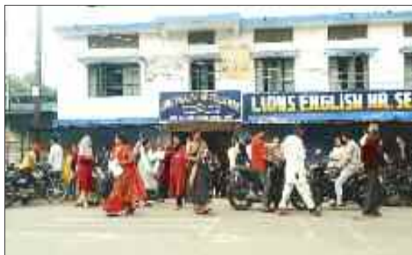
परीक्षा केंद्र से बाहर निकलते परीक्षार्थी।

प्रथम पाली की परीक्षा में प्राथमिक स्कूल में पढ़ाने के लिए परीक्षार्थी बैठे थे। जिसमें सामान्य तरह के सवाल पूछे गए थे, जिनमें पहली से 5वीं तक पढ़ाए जाने वाले सभी विषय शामिल हैं। वहीं मीडिल स्कूल में पढ़ाने के लिए जो परीक्षार्थी बैठे थे उन्हें विषयवार पूछे गए प्रश्नों का जवाब देना पड़ा। इसके लिए परीक्षार्थियों को आवेदन देने के समय अपना परसंदर्भ विषय का आश्चय देना पड़ना था। आज परीक्षा में मीडिल स्कूल के लिए परीक्षा दिलाने वाले परीक्षार्थियों को विषयवार प्रश्न पत्र दिए गए थे, जिसमें सभी विषय के प्रश्न शामिल थे गणित, विज्ञान जैसे विषय प्रमुख थे।