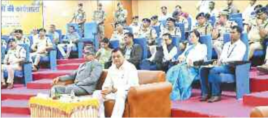
कार्यशाला में उपस्थित न्यायाधीश, श्रम मंत्री एवं अन्य।

जिला प्रशासन एवं पुलिस द्वारा भारतीय न्याय संहिता, भारतीय नागरिक सुरक्षा संहिता और भारतीय साक्ष्य अधिनियम के बारे में न्यायिक दंडाधिकारी, प्रशासनिक अधिकारी, व पुलिस विभाग के अधिकारियों