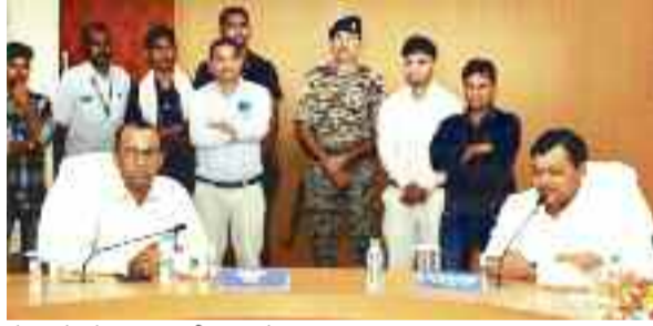
बैठक के दौरान श्रम मंत्री एवं कलेक्टर।